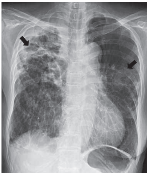
Fig. 1 Chest radiograph on admission shows opacification in right upper and left middle lung field (arrow). Known thick-walled cavitory lesion due to old pulmonary tuberculosis complicated by secondary Aspergillosis is observed in right apex.