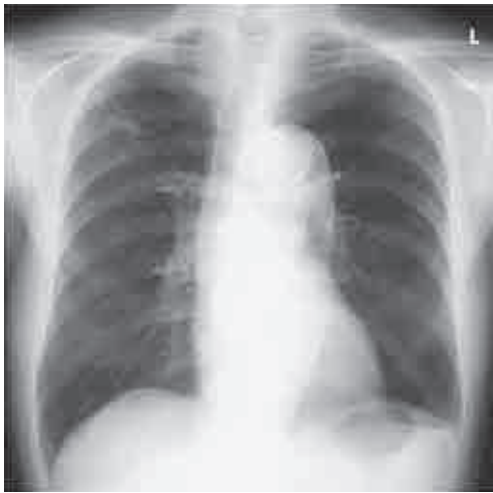
Fig. 1 Chest radiograph at diagnosis, showing nodular shadows bilaterally.