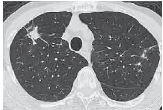
Fig. 3 Chest CT at diagnosis, showing small nodular shadows in both upper lobes. There is a large nodule in the right S 3 .