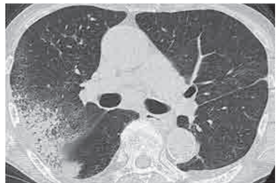
Fig. 4 Chest CT on admission, showing diffuse bilateral ground-glass opacities, dense consolidation in the right S 2 , septal thickening, and a small amount of pleural effusion.